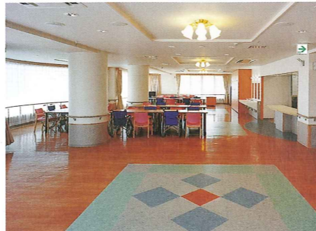
通所食堂・機能訓練室